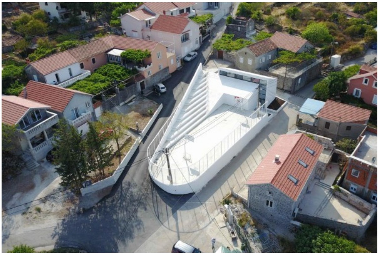
Bild: Sieger Kategorie Neubau: Local Community Center "Gošići", AIM Studio, ME-Podgorica