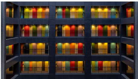
Ist da wer?

In Tokios Stadtparks gibt es jetzt bunte, von Architekten entworfene öffentliche Toiletten. Das Besondere: Sie sind durchsichtig. Und ja, das ist Absicht. Mehr>