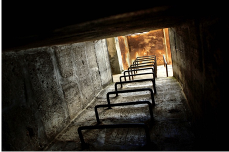
Zwei Meter Wand

Immer mehr Bunker werden in extravagante Immobilien umgebaut. Für Architekten ist das eine besondere Herausforderung - aber auch für die späteren Bewohner. Mehr>