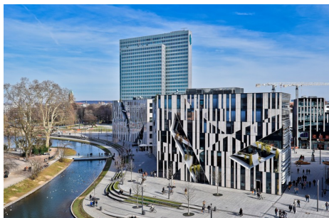
Hecke der Hoffnung

Über grüne Stadtarchitektur wird viel geredet. Düsseldorf ist einen Schritt weiter, dort trägt in der City ein neuer Gebäudekomplex jetzt ein üppiges Blätterkleid. Mehr>